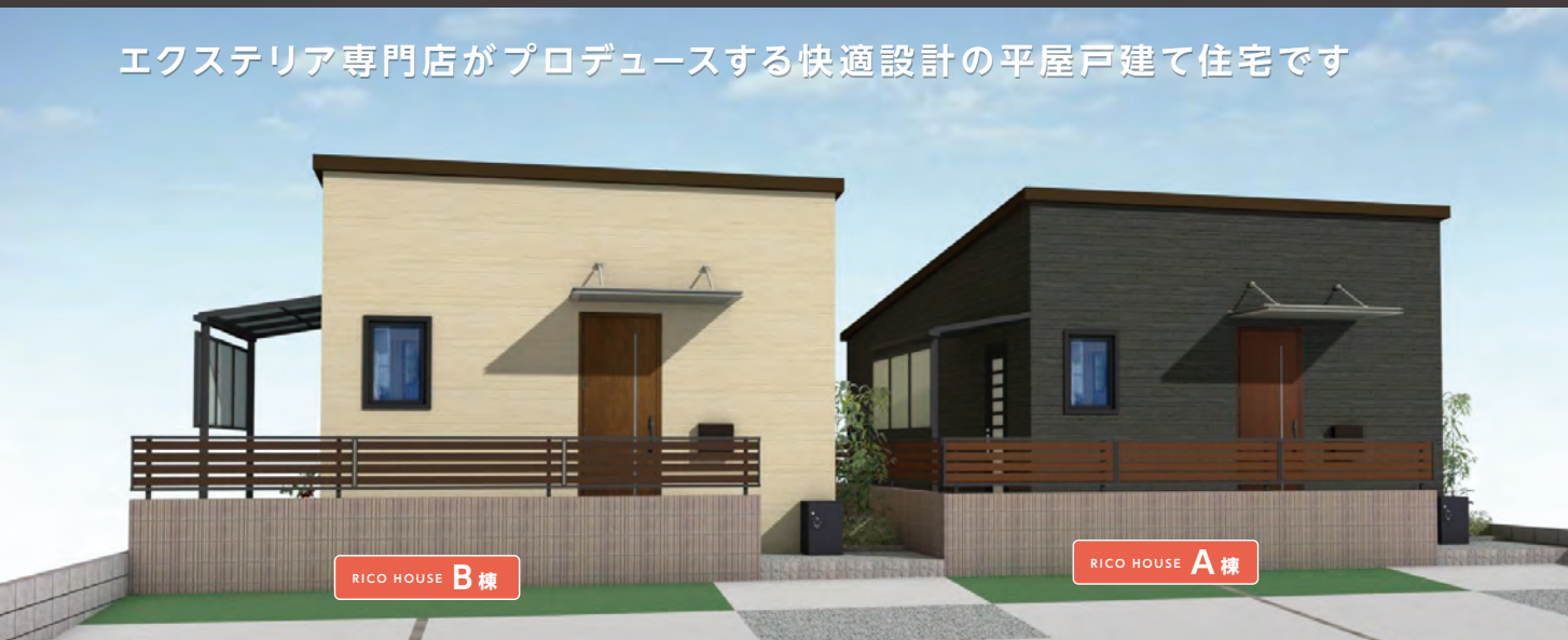
RICO HOUSE B棟