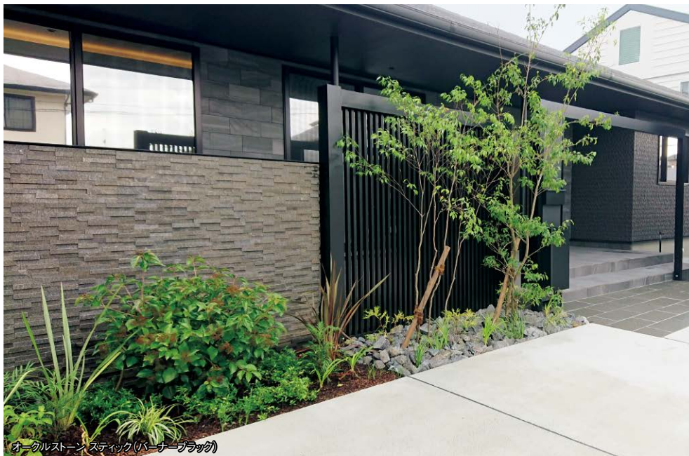
オークルストーン スティック (バーナーブラック)